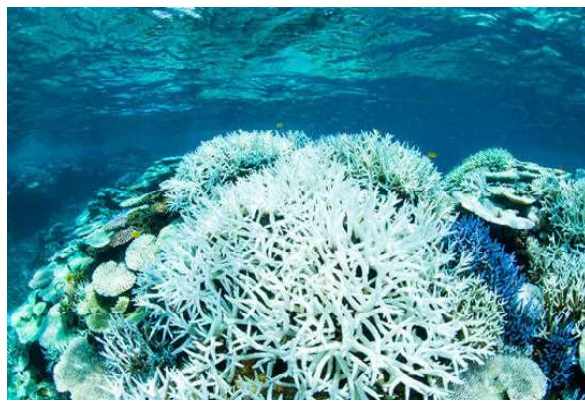
B-2 白化したサンゴ(沖縄)

【課題】4枚の写真から、小学1年生に学ばせたいテーマ(課題)をひとつ設定してください。