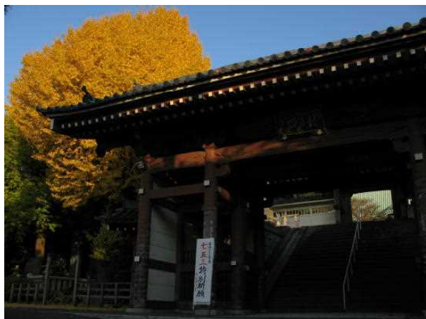
A-1 紅葉したイチョウの木(鎌倉)