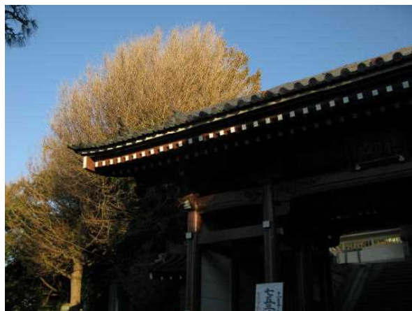
A-2 塩害を受けたイチョウの木(鎌倉)