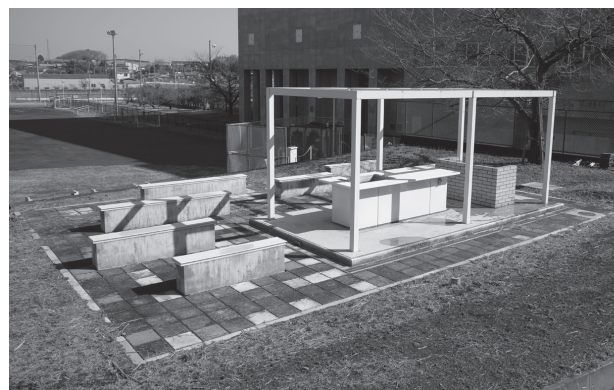
バーベキュー施設

・利用当日は警備員室にて「学内施設使用許可書(控え)」及び学生証と引き換えに鍵を受け取ってください。