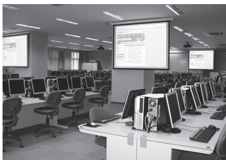
厚木キャンパスPC演習室

自習や遠隔授業の受講で大学以外の場所からPC演習室のコンピュータを利用する必要がある場合は、自宅のPCなどから遠隔利用することが可能です。