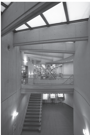
中野キャンパス 中野図書館