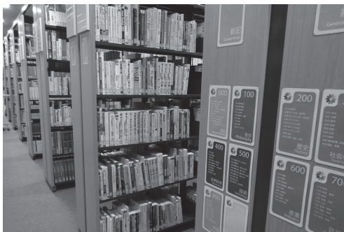
厚木キャンパス 中央図書館